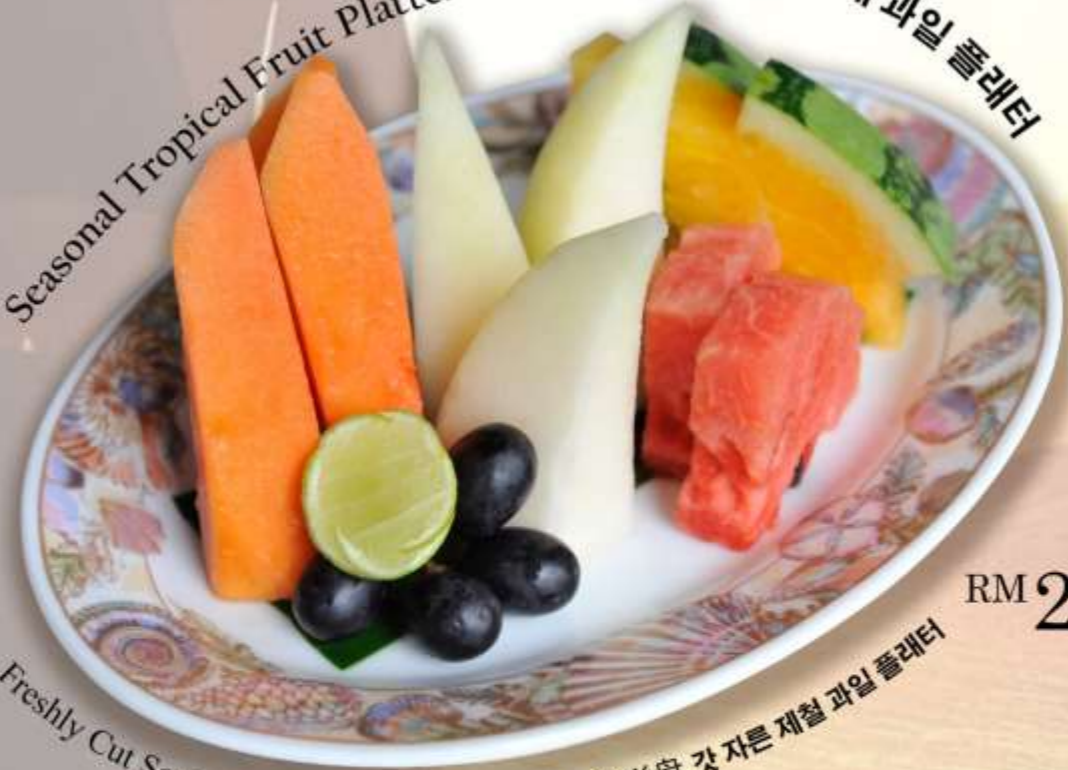
Seasonal Tropical Fruit Platter 时令水果拼盘 계절 열대 과일 플레터