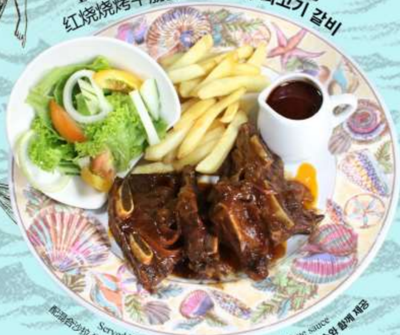
Braised Barbecue Beef Rib 红烧烧烤牛肋排 찐 바베크 쇠고기 갈비