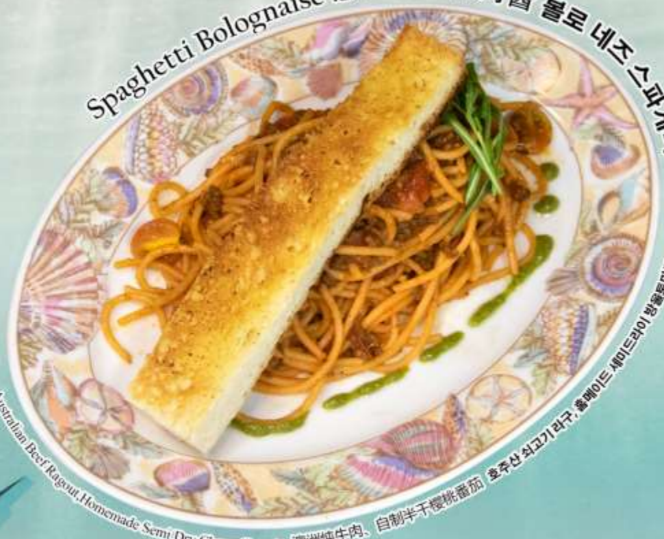
Australian Beef Ragout, Homemade Semi-Dry Cherry Tomato 澳洲炖牛肉、自制半干樱桃番茄