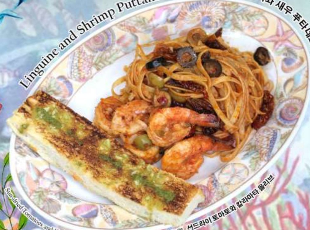
Sun-dried Tomatoes and Kalamata Olives 晒干的西红柿和卡拉马塔橄榄 선드라이 토마토와 칼라마타 올리브