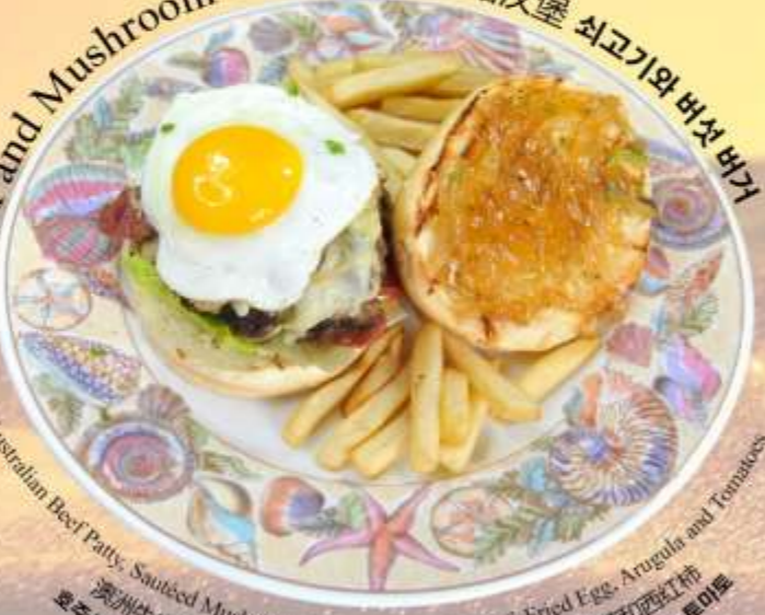
Beef and Mushroom Burger 牛肉蘑菇汉堡 쇠고기와 버섯 버거

Australian Beef Patty, Sautéed Mushroom & Onion, Streaky Beef, Fried Egg, Arugula and Tomatoes 澳洲牛肉饼, 炒蘑菇洋葱, 五花牛肉, 煎鸡蛋, 芝麻菜和西红柿 호주산 쇠고기 패티, 버섯 & 양파 볶음, 줄무늬 쇠고기, 계란후라이, 아루굴라, 토마토