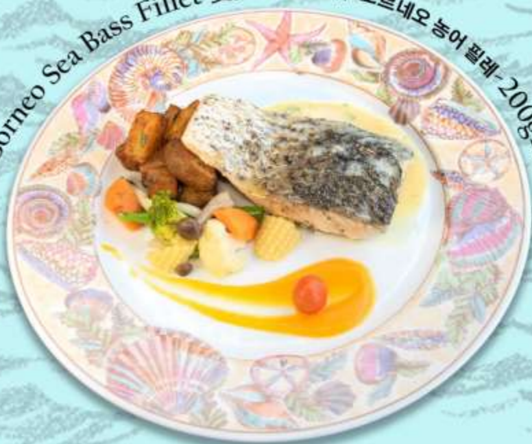
Borneo Sea Bass Fillet 婆罗洲鲈鱼柳 보르네오 농어 필레-200gm