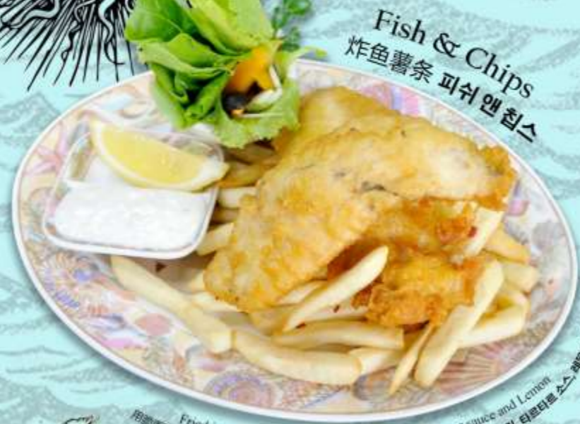
Fish & Chips 炸鱼薯条 피쉬 앤 칩스

"Our chef will be delighted to assist with any dietary requirements" From The Ocean 来自海洋 바다에서