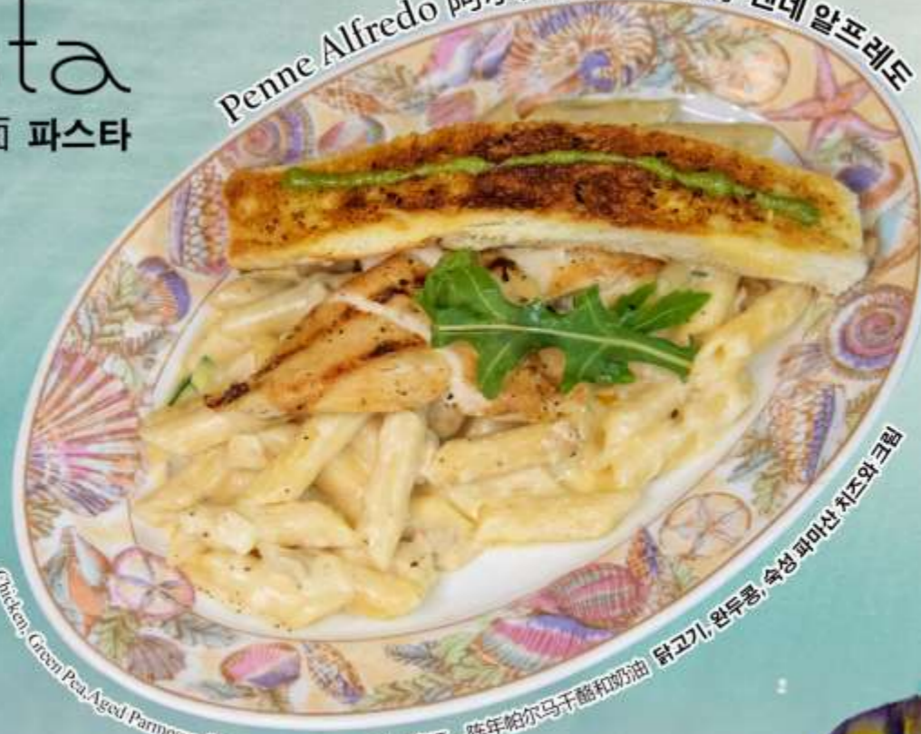
Chicken, Green Pea, Aged Parmesan Cheese and Cream 鸡肉、青豆、陈年帕尔马干酪和奶油