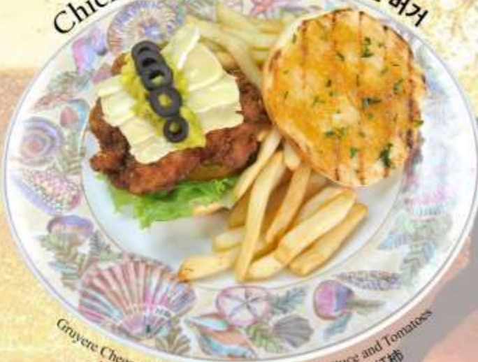
Chicken Burger 鸡肉汉堡 치킨 버거

Gruyere Cheese, Avocado, Pineapple chutney, Lettuce and Tomatoes 格鲁耶尔奶酪, 鳄梨, 菠萝酸辣酱, 生菜和西红柿 그뤼에르 치즈, 아보카도, 파인애플 처트니, 양상추, 토마토