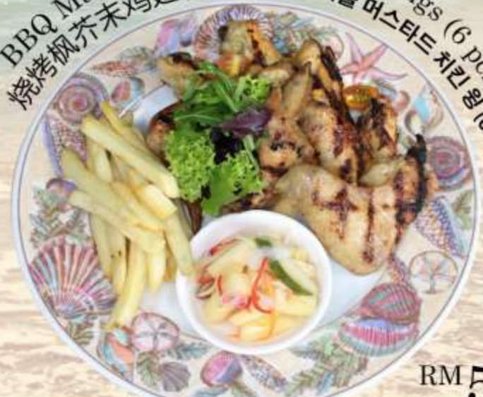
BBQ Maple Mustard Chicken Wings (6 pcs) 烧烤枫芥末鸡翅(6个) BBQ 메이플 머스타드 치킨 윙 (6개)

Pickles, Garden Vegetables & steak Fries 腌菜和薯条 채소 절임 & 스테이크 감자튀김 RM 50 nett