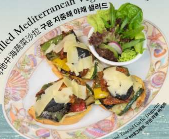
Grilled Mediterranean Vegetable Salad 烤地中海蔬菜沙拉 구운 지중해 야채 샐러드

Grilled Vegetables, Balsamic Vinaigrette and Toasted Garlic Baguette 烤蔬菜, 香醋和烤大蒜长棍面包 구운 야채, 발사믹 비네그레트, 구운 마늘 바게트 RM 42 nett