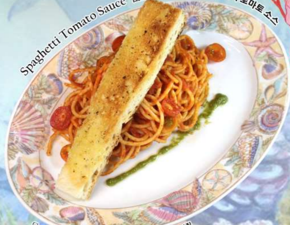
Cherry Tomatoes and Basil 樱桃番茄和罗勒 체리 토마토와 바질