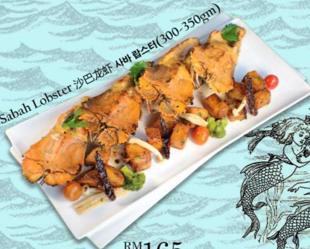
Sabah Lobster 沙巴龙虾 사바 랍스터(300-350gm)