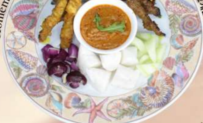
Homemade Satay (12pcs) 自制沙爹(12条) 홈메이드 사테이 (12개입)

12 Skewers of Char-Grilled Chicken and Beef Satay served with Traditional Compressed Rice, Onions and Peanut Sauce 12 串炭烤鸡肉和牛肉沙爹, 配传统压缩米饭, 洋葱和咖喱花生酱 숯불에 구운 닭고기 꼬치 12개와 쇠고기 사테이, 전통적인 압축 쌀, 양파, 카레 땅콩 소스와 함께 제공 RM 50 nett