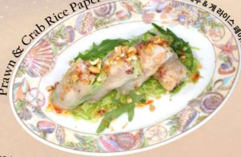
Prawn & Crab Rice Paper Rolls 虾蟹米纸卷 새우 & 게 라이스페이퍼 롤

Green Papaya, Cucumber, Carrot, Pea Sprouts, Sea Prawn, Crab meat, Vermicelli, Crushed Peanut, Rice Paper Roll, with Citrus plum Dressing 青木瓜, 黄瓜, 胡萝卜, 豌豆芽, 海虾, 蟹肉, 粉丝, 花生碎, 宣纸卷, 柑橘酱 그린파파야, 오이, 당근, 완두콩나물, 새우, 게살, 당면, 으깬땅콩, 라이스페이퍼롤, 자두드레싱 RM 48 nett