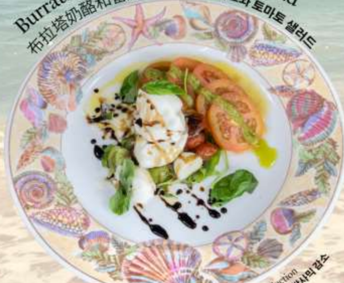
Burrata Cheese and Tomato Salad 布拉塔奶酪和番茄沙拉 부라타 치즈와 토마토 샐러드

Garden Tomatoes, Basil and Balsamic Reduction 花园番茄, 罗勒和意大利香醋 가든 토마토, 바질 및 발사믹 감소 RM 48 nett