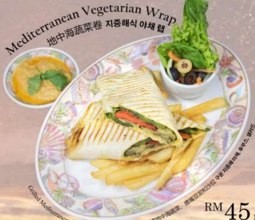
Mediterranean Vegetarian Wrap 地中海蔬菜卷 지중해식 야채 랩

Grilled Mediterranean Vegetables, Hummus and Salad 烤地中海蔬菜, 鹰嘴豆泥和沙拉 구운 지중해 야채, 후무스, 샐러드