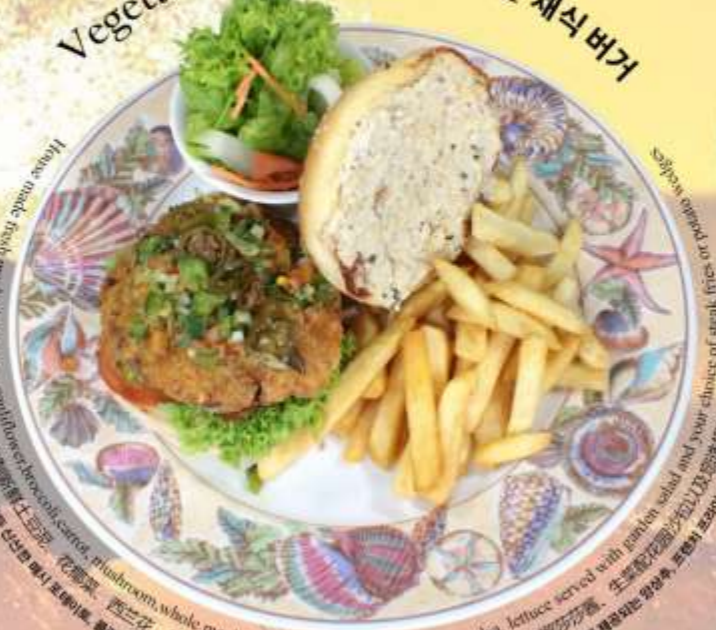
Vegetarian Burger 素食汉堡 채식 버거

House made fresh minced potatoes, cauliflower, broccoli, carrot, mushroom, whole meal bun, hummus, tomato-jalapeno salsa, lettuce served with garden salad and your choice of steak, fish, or chicken. 自家製 신선한 찍은 감자, 브로콜리, 양파, 토마토, 호박, 양파, 브로콜리, 버섯, 통밀빵, 호두콩, 토마토-할라피뇨 샐러드, 가든 샐러드와 함께 제공되는 양고기, 생선, 닭고기 또는 닭고기 요리 선택