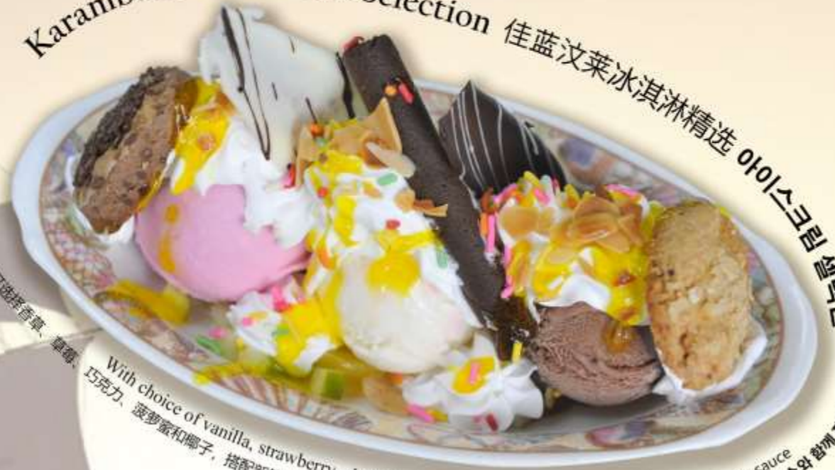
Karambunai Ice Cream Selection 佳蓝汶莱冰淇淋精选 아이스크림 셀렉션

With choice of vanilla, strawberry, chocolate, Jackfruits and coconut serves with fresh fruits sauce 可选择香草、草莓、巧克力、菠萝蜜和椰子，搭配新鲜水果酱 바닐라, 딸기, 초콜릿, 잭프루트, 코코넛 중에서 선택하여 신선한 과일 소스와 함께 제공