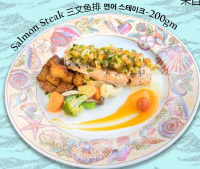
Salmon Steak 三文鱼排 연어 스테이크-200gm