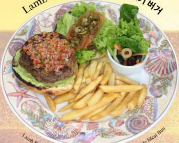
Lamb Burger 羊肉汉堡 양고기 버거

Lamb Patty, Guacamole, Pico De Gallo, Jalapeño and Whole Meal Bun 羊肉饼, 鳄梨酱, 墨西哥莎莎酱, 墨西哥辣椒和全麦面包 양고기 패티, 과카몰리, 피코 데 가요, 할라피뇨 및 통밀빵