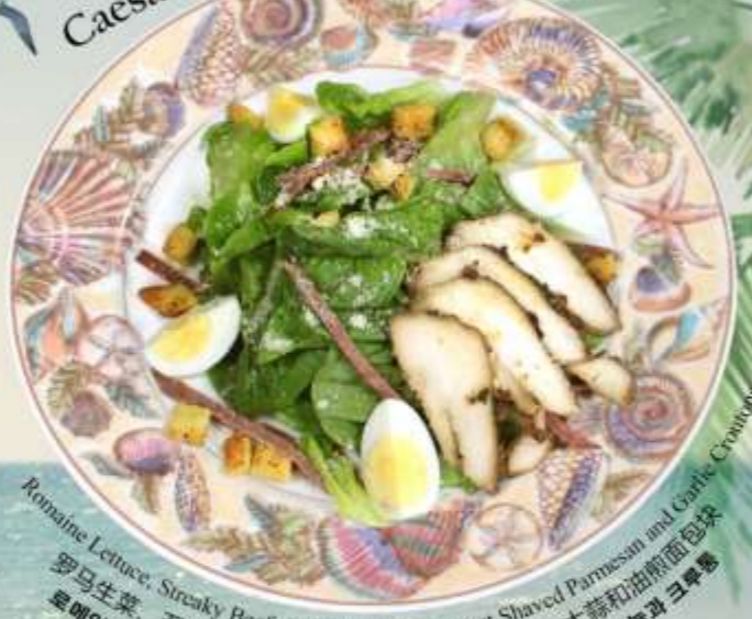
Caesar Salad 凯撒沙拉 시저 샐러드

Romaine Lettuce, Steaky Beef, Grilled Chicken Breast Shaved Parmesan and Garlic Croutons 罗马生菜, 五花牛肉, 烤鸡胸肉, 帕尔玛干酪片, 大蒜和油煎面包块 로메인 상추, 스테이크 소고기, 구운 닭가슴살, 썬 파마산 치즈, 마늘과 크루통 RM 42 nett