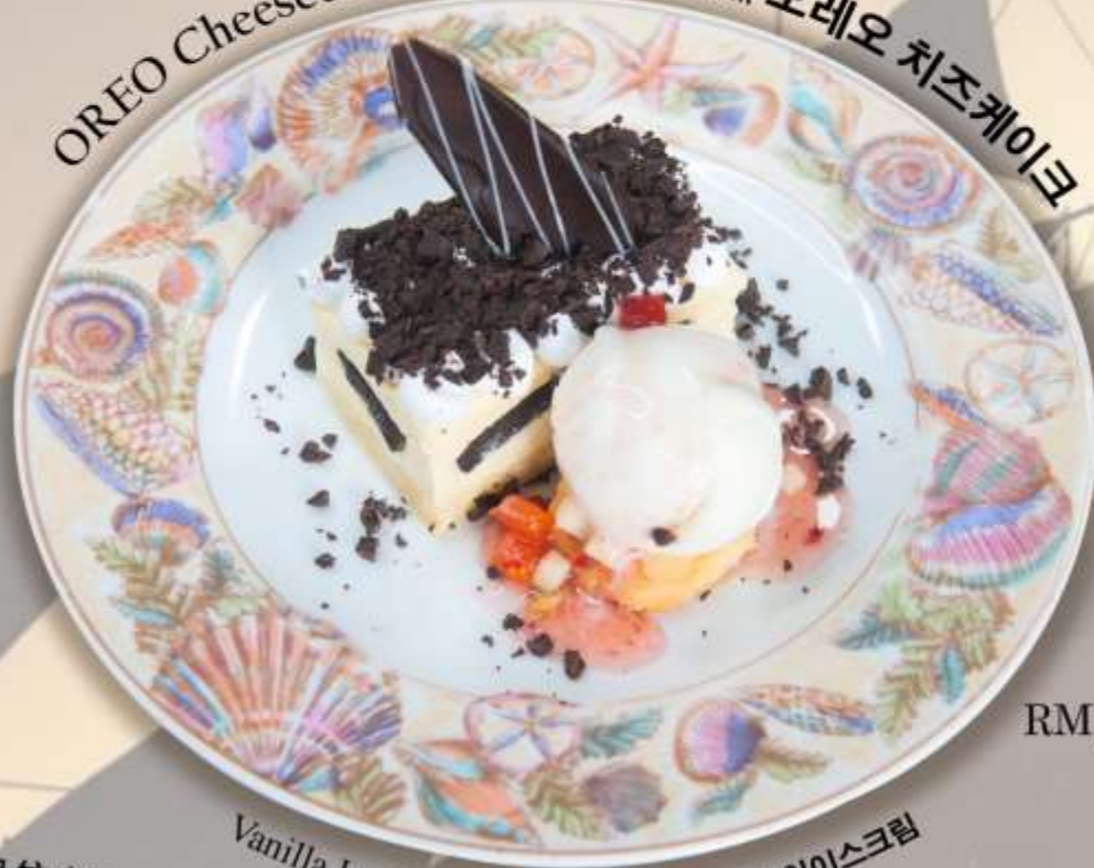
OREO Cheesecake 奥利奥芝士蛋糕 오레오 치즈케이크

"Our chef will be delighted to assist with any dietary requirements"