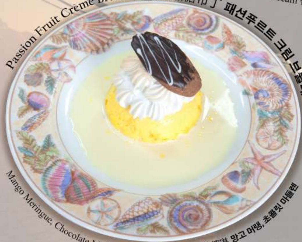
Passion Fruit Crème Brûlée 百香果焦糖布丁 패션푸르트 크림 브릴레 Vanilla Ice Cream 香草冰淇淋 바닐라 아이스크림