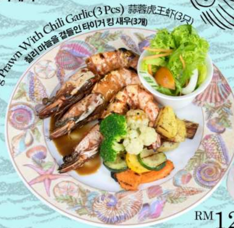
Tiger King Prawn With Chili Garlic(3 Pcs) 蒜蓉虎王虾(3只) 칠리마늘을 곁들인 타이거 킹 새우(3개)