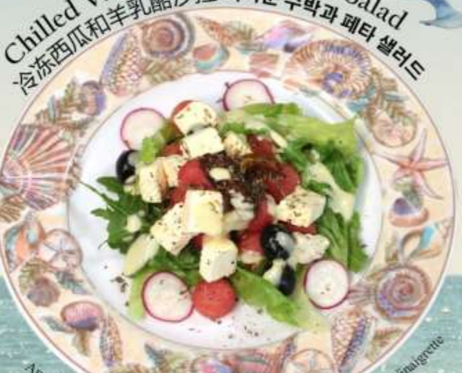
Chilled Watermelon and Feta Salad 冷冻西瓜和羊乳酪沙拉 차가운 수박과 페타 샐러드

Arugula, Marinated Feta, Kalamata Olives, Red Radish and Citrus Vinaigrette 芝麻菜, 腌制羊乳酪, 卡拉马塔橄榄, 红萝卜和柑橘油醋汁 아루굴라, 절인 페타 치즈, 칼라마타 올리브, 적후 및 시트러스 비네그레트 RM 42 nett