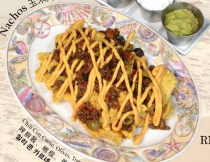
Nachos 玉米片 나초

Chili Con Carne, Olives, Tomato Salsa Cheese Sauce and Sour Cream. 辣椒酱, 橄榄, 番茄莎莎酱, 奶酪酱和酸奶油 칠리 콘 카르네, 올리브, 토마토 샐사, 치즈 소스 및 RM 45 nett