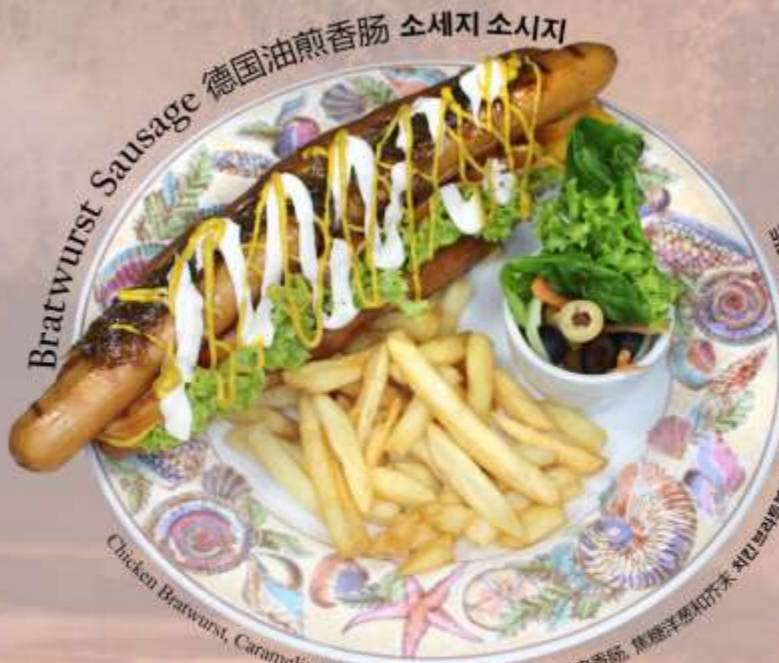
Bratwurst Sausage 德国油煎香肠 소세지 소시지

Chicken Bratwurst, Caramelized Onion and French Mustard 鸡肉香肠, 焦糖洋葱和芥末 치킨 브라우트스트, 캐러멜라이즈드 양파, 케리발레 마스터드