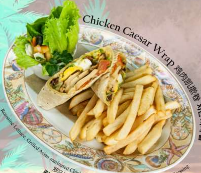
Chicken Caesar Wrap 鸡肉凯撒卷 치킨시저 랩

Romaine Lettuce, Grilled Asian marinated Chicken, Parmesan, Silver Anchovies and Caesar Dressing 罗马生菜, 烤亚洲腌鸡, 帕尔马干酪, 银凤尾鱼和凯撒酱 로메인 상추, 구운 아시아식 마리네이드 치킨, 파마산 치즈, 은멸치, 시저 드레싱