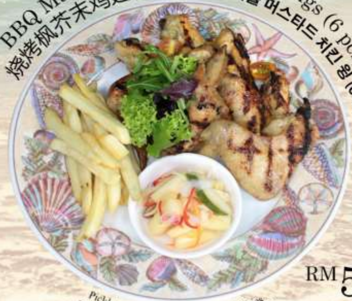
BBQ Maple Mustard Chicken Wings (6 pcs) 烧烤枫芥末鸡翅(6个) BBQ 메이플 머스타드 치킨 윙 (6개)

Pickles, Garden Vegetables & steak Fries 腌菜和薯条 채소 절임 & 스테이크 감자튀김 RM 50 nett