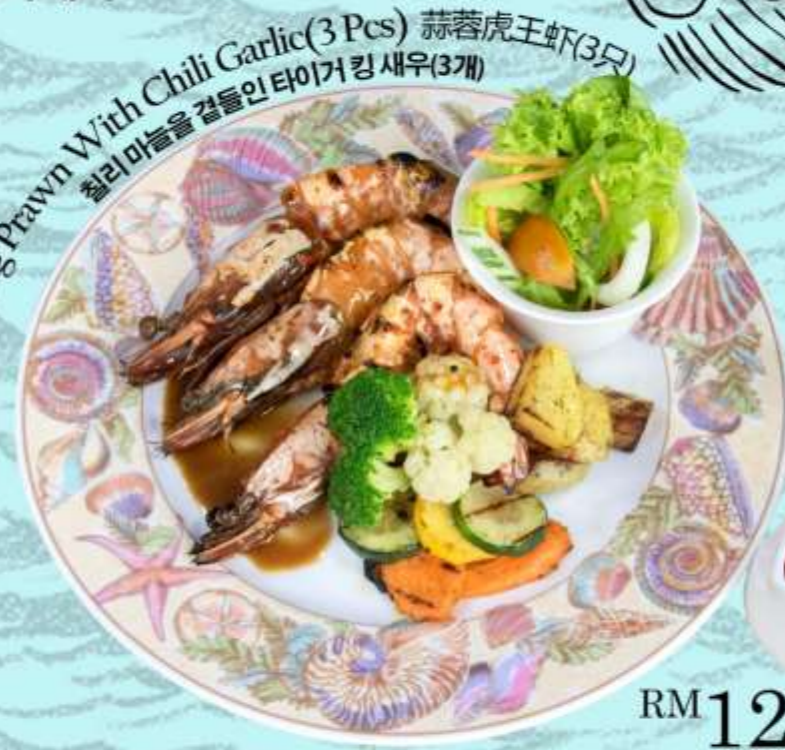
Tiger King Prawn With Chili Garlic(3 Pcs) 蒜蓉虎王虾(3只) 칠리마늘을 곁들인 타이거 킹 새우(3개)