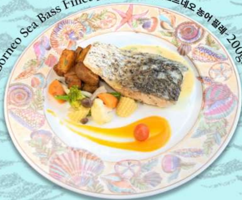
Borneo Sea Bass Fillet 婆罗洲鲈鱼柳 보르네오 농어 필레-200gm