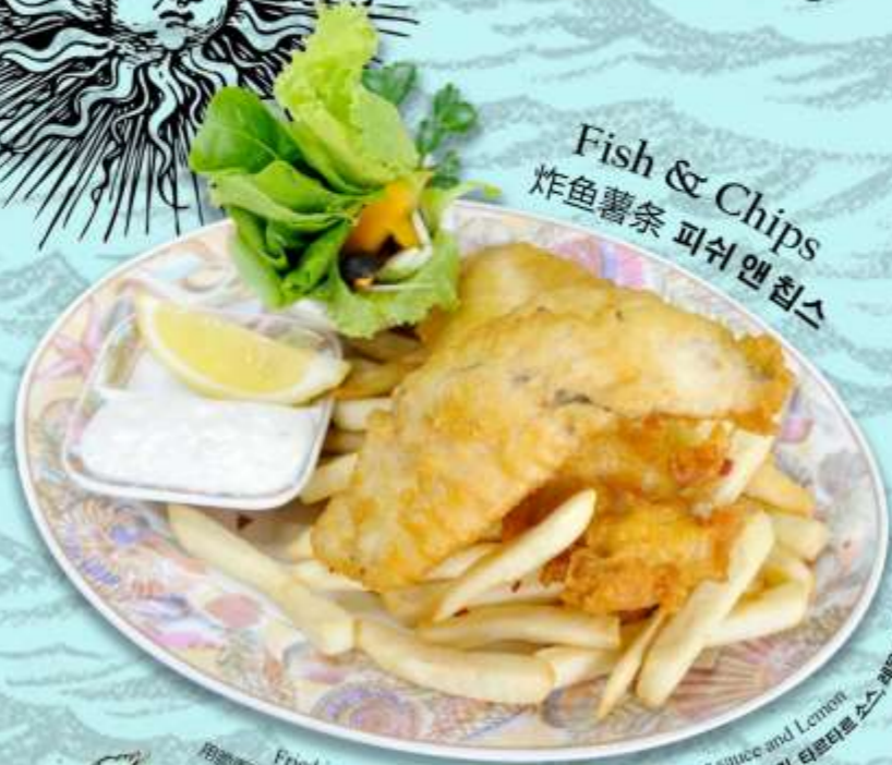
Fish & Chips 炸鱼薯条 피쉬 앤 칩스

"Our chef will be delighted to assist with any dietary requirements" From The Ocean 来自海洋 바다에서