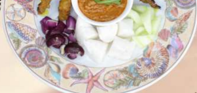
Homemade Satay (12pcs) 自制沙爹(12条) 홈메이드 사테이 (12개입)

12 Skewers of Char-Grilled Chicken and Beef Satay served with Traditional Compressed Rice, Onions and Peanut Sauce 12 串炭烤鸡肉和牛肉沙爹, 配传统压缩米饭, 洋葱和咖喱花生酱 숯불에 구운 닭고기 꼬치 12개와 쇠고기 사테이, 전통적인 압축 쌀, 양파, 카레 땅콩 소스와 함께 제공 RM 50 nett