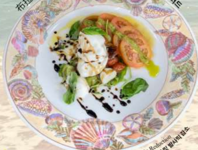
Burrata Cheese and Tomato Salad 布拉塔奶酪和番茄沙拉 부라타 치즈와 토마토 샐러드

Garden Tomatoes, Basil and Balsamic Reduction 花园番茄, 罗勒和意大利香醋 가든 토마토, 바질 및 발사믹 감소 RM 48 nett