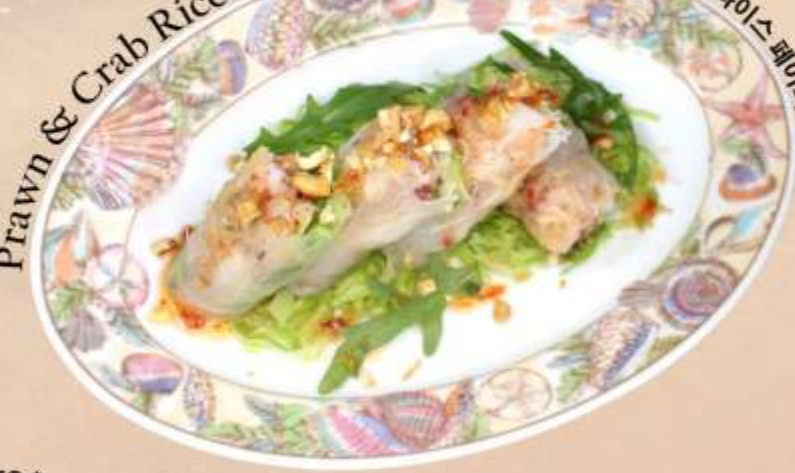
Prawn & Crab Rice Paper Rolls 虾蟹米纸卷 새우 & 게 라이스페이퍼 롤

Green Papaya, Cucumber, Carrot, Pea Sprouts, Sea Prawn, Crabmeat, Vermicelli, Crushed Peanut, Rice Paper Roll, with Citrus plum Dressing 青木瓜, 黄瓜, 胡萝卜, 豌豆芽, 海虾, 蟹肉, 粉丝, 花生碎, 宣纸卷, 柑橘酱 그린파파야, 오이, 당근, 완두콩나물, 새우, 게살, 당면, 으깬땅콩, 라이스페이퍼롤, 자두드레싱 RM 48 nett