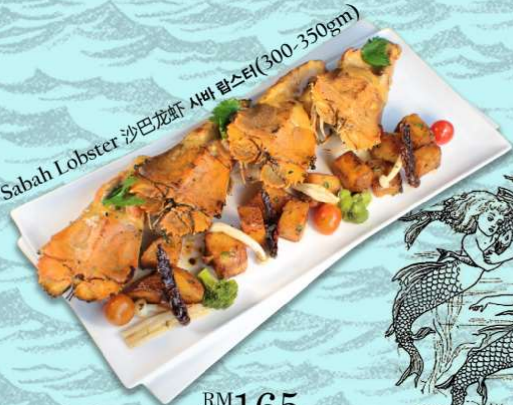
Sabah Lobster 沙巴龙虾 사바 랍스터(300-350gm)