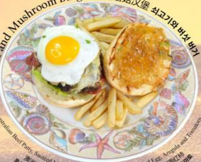
Beef and Mushroom Burger 牛肉蘑菇汉堡 쇠고기와 버섯 버거

Australian Beef Patty, Sautéed Mushroom & Onion, Streaky Beef, Fried Egg, Arugula and Tomatoes 澳洲牛肉饼, 炒蘑菇洋葱, 五花牛肉, 煎鸡蛋, 芝麻菜和西红柿 호주산 쇠고기 패티, 버섯 & 양파 볶음, 줄무늬 쇠고기, 계란후라이, 아루굴라, 토마토