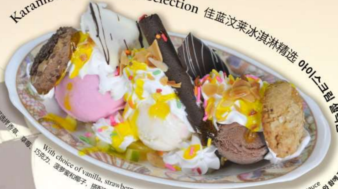
Karambunai Ice Cream Selection 佳蓝汶莱冰淇淋精选 아이스크림 셀렉션

With choice of vanilla, strawberry, chocolate, Jackfruits and coconut serves with fresh fruits sauce 可选择香草、草莓、巧克力、菠萝蜜和椰子，搭配新鲜水果酱 바닐라, 딸기, 초콜릿, 잭프루트, 코코넛 중에서 선택하여 신선한 과일 소스와 함께 제공