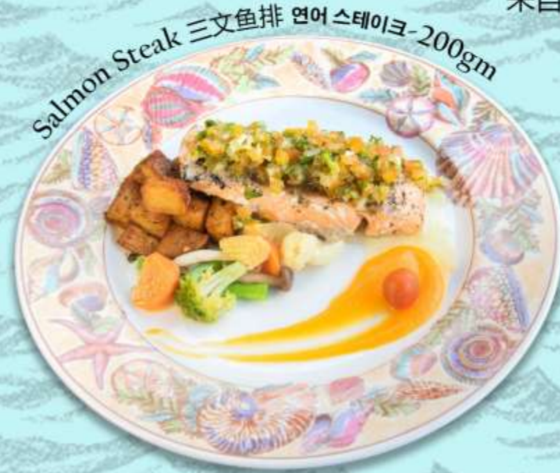
Salmon Steak 三文鱼排 연어 스테이크-200gm