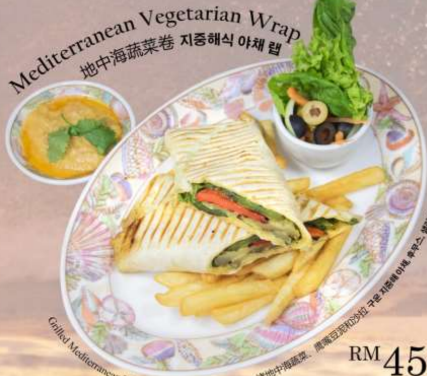
Mediterranean Vegetarian Wrap 地中海蔬菜卷 지중해식 야채 랩

Grilled Mediterranean Vegetables, Hummus and Salad 烤地中海蔬菜, 鹰嘴豆泥和沙拉 구운 지중해 야채, 후무스, 샐러드