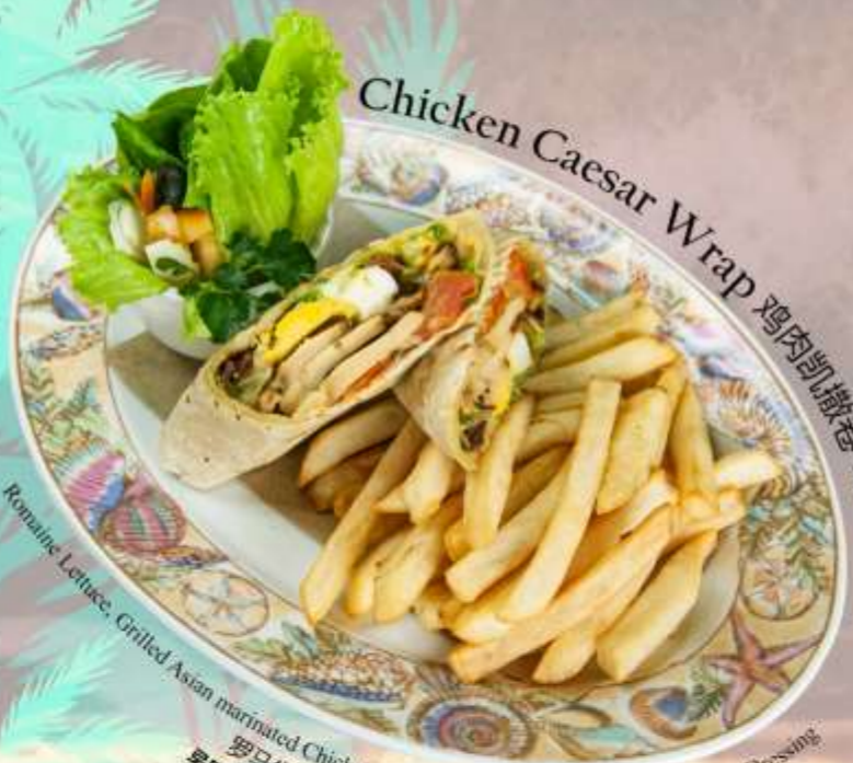
Chicken Caesar Wrap 鸡肉凯撒卷 치킨시저랩

Romaine Lettuce, Grilled Asian marinated Chicken, Parmesan, Silver Anchovies and Caesar Dressing 罗马生菜, 烤亚洲腌鸡, 帕尔马干酪, 银凤尾鱼和凯撒酱 로메인 상추, 구운 아시아식 마리네이드 치킨, 파마산 치즈, 은멸치, 시저 드레싱