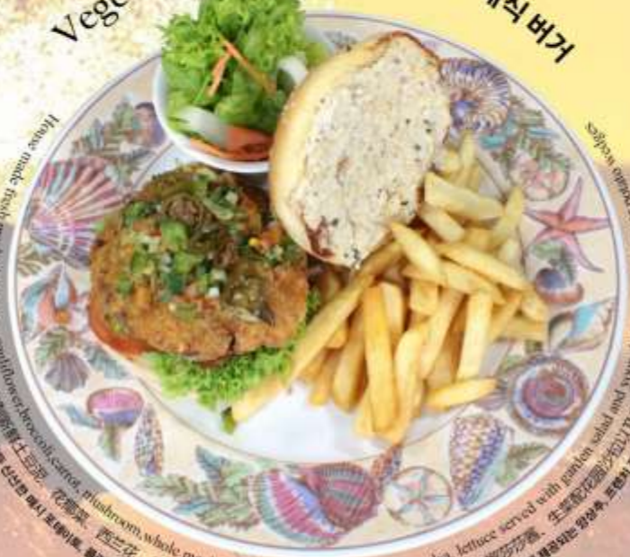
Vegetarian Burger 素食汉堡 채식 버거

House made fresh minced potatoes, cauliflower, broccoli, carrot, mushroom, whole meal bun, hummus, tomato-jalapeno salsa, lettuce served with granola salad and your choice of steak, fish or chicken. 自家製 신선한 찐 감자, 양배추, 브로콜리, 당근, 버섯, 통밀빵, 호두콩, 토마토-할라피뇨 샐러드, 상추, 가운 샐러드와 함께 제공되는 양고기, 생선 또는 닭고기 요리 선택