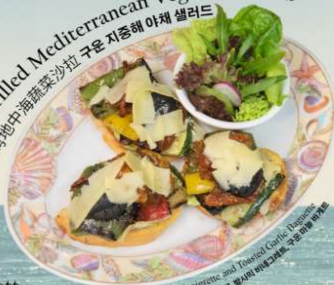
Grilled Mediterranean Vegetable Salad 烤地中海蔬菜沙拉 구운 지중해 야채 샐러드

Grilled Vegetables, Balsamic Vinaigrette and Toasted Garlic Baguette 烤蔬菜, 香醋和烤大蒜长棍面包 구운 야채, 발사믹 비네그레트, 구운 마늘 바게트 RM 42 nett