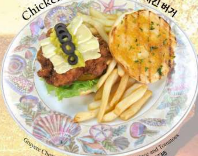
Chicken Burger 鸡肉汉堡 치킨 버거

Gruyere Cheese, Avocado, Pineapple chutney, Lettuce and Tomatoes 格鲁耶尔奶酪, 鳄梨, 菠萝酸辣酱, 生菜和西红柿 그뤼에르 치즈, 아보카도, 파인애플 처트니, 양상추, 토마토