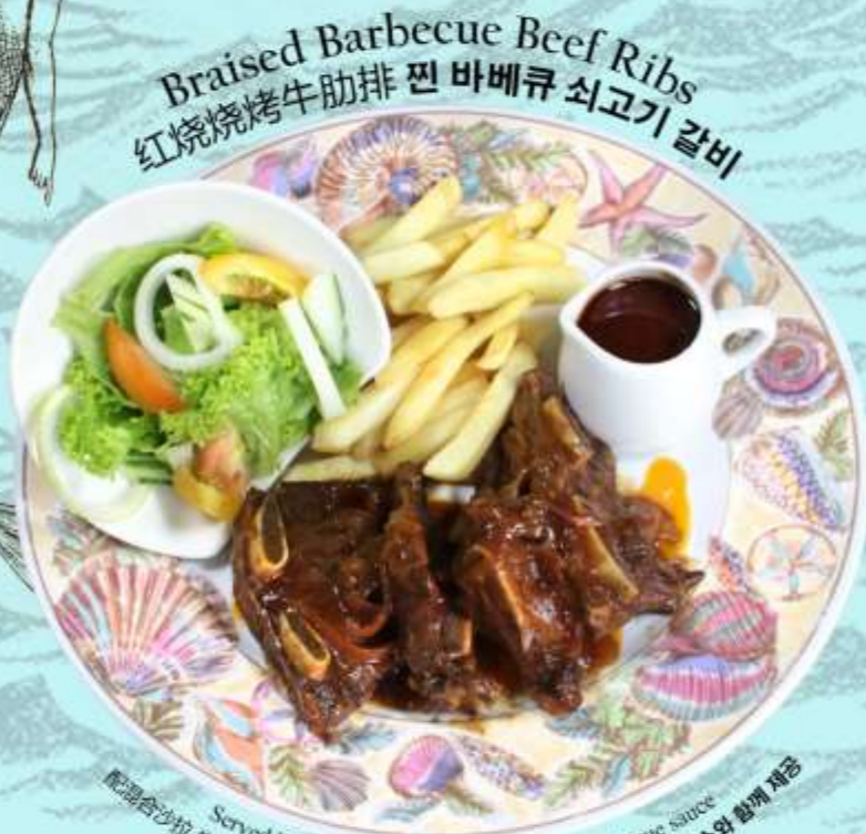
Braised Barbecue Beef Ribs 红烧烧烤牛肋排 찐 바베크 쇠고기 갈비