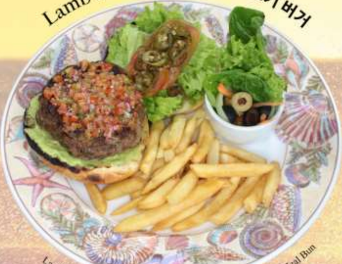
Lamb Burger 羊肉汉堡 양고기 버거

Lamb Patty, Guacamole, Pico De Gallo, Jalapeño and Whole Meal Bun 羊肉饼, 鳄梨酱, 墨西哥莎莎酱, 墨西哥辣椒和全麦面包 양고기 패티, 과카몰리, 피코 데 가요, 할라피뇨 및 통밀빵