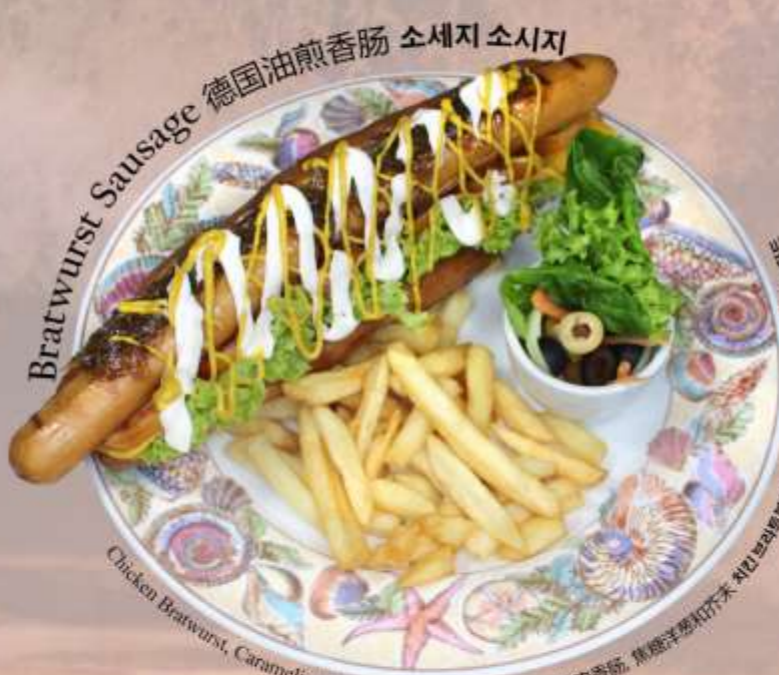
Bratwurst Sausage 德国油煎香肠 소세지 소시지

Chicken Bratwurst, Caramelized Onion and French Mustard 鸡肉香肠, 焦糖洋葱和芥末 치킨 브라우트스트, 캐러멜라이즈드 양파, 케라멜라이즈드 양파, 프랑스 겨자