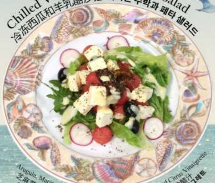
Chilled Watermelon and Feta Salad 冷冻西瓜和羊乳酪沙拉 차가운 수박과 페타 샐러드

Arugula, Marinated Feta, Kalamata Olives, Red Radish and Citrus Vinaigrette 芝麻菜, 腌制羊乳酪, 卡拉马塔橄榄, 红萝卜和柑橘油醋汁 아루굴라, 절인 페타 치즈, 칼라마타 올리브, 적우 및 시트러스 비네그레트 RM 42 nett